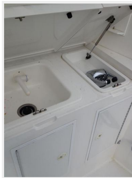
Cockpit / Fishing Equipment 4 - Cockpit Sink & Engine Controls