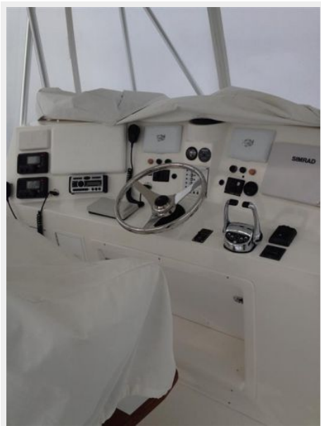
Helm / Electronics & Navigation 1