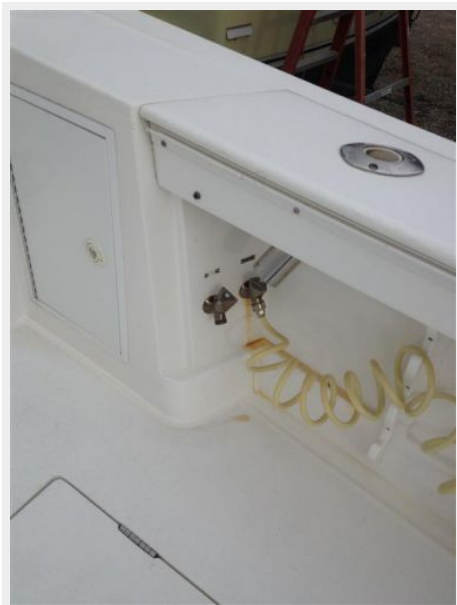
Deck 3 - Salt Water Wash Down