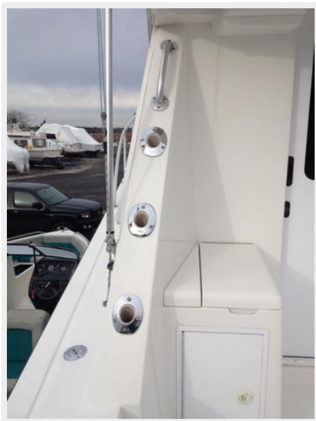
Cockpit / Fishing Equipment 3 - Rod Holders in Gunnel