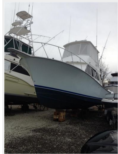
Deck 2 - Bow