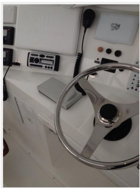
Helm / Electronics & Navigation 3