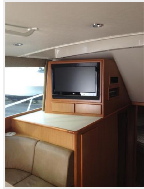
Salon 3 - Entertainment Center