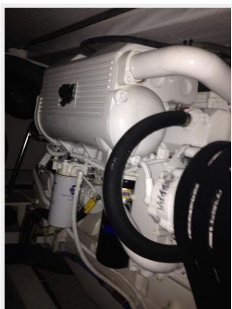
Engine & Mechanical Equipment 4