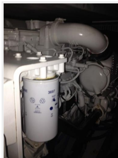
Engine & Mechanical Equipment 3