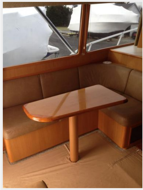
Salon 2 - Dinette