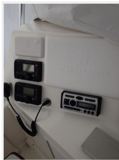
Helm / Electronics & Navigation 4 - Electronics