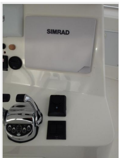
Helm / Electronics & Navigation 5 - Electronics