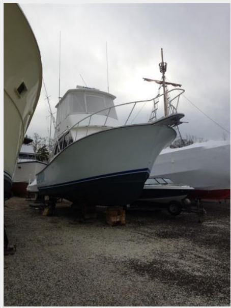
Deck 1 - Bow