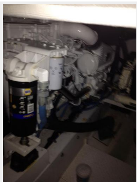
Engine & Mechanical Equipment 2