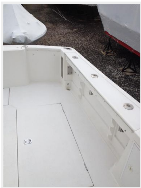
Cockpit / Fishing Equipment 5 - Rod Holders