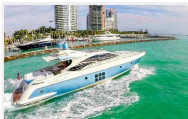
Profile Starboard II