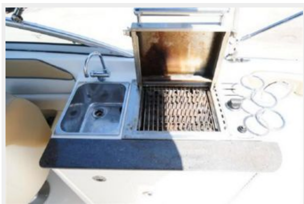
Grill and Sink