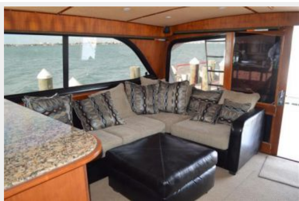
54' Egg Harbor Salon Aft