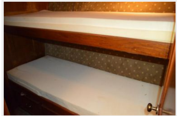
54' Egg Harbor Guest Stateroom