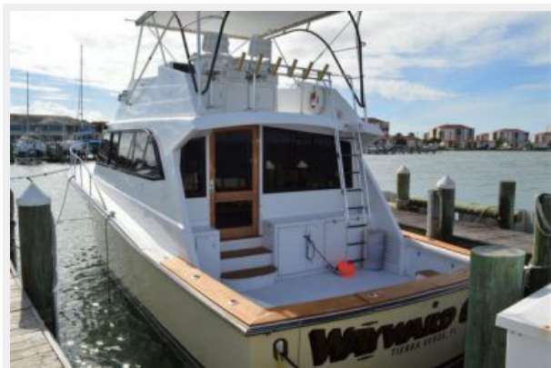
54' Egg Harbor Port Aft Profile