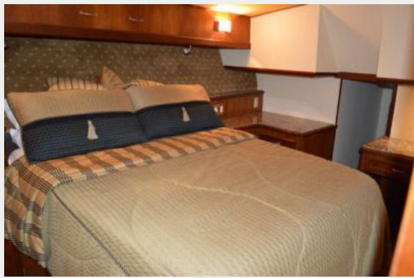
54' Egg Harbor Master Stateroom