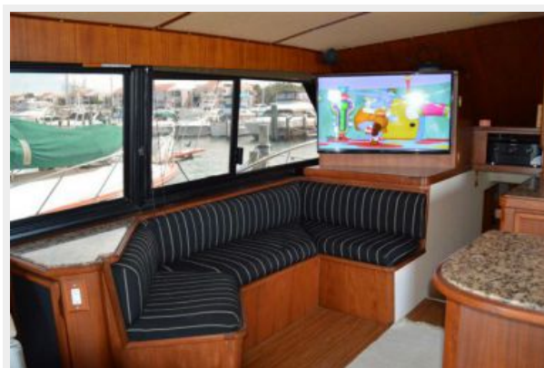
54' Egg Harbor Salon Forward