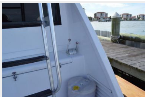
54' Egg Harbor Cockpit Controls