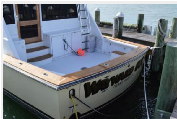
54' Egg Harbor Cockpit