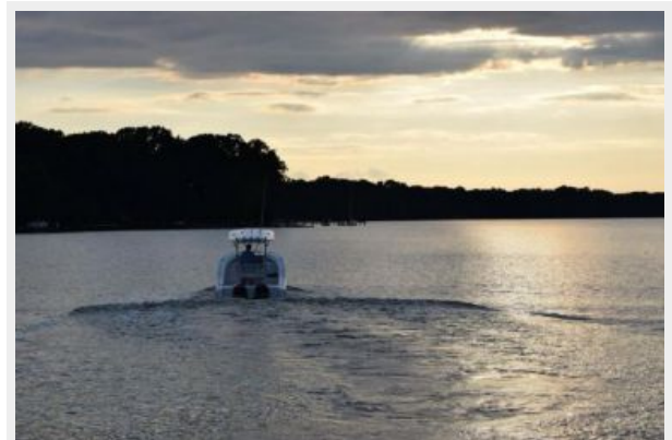
Into The Sunset