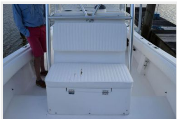
Cushions and Pads