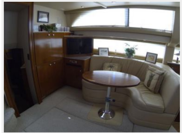
Dinette & TV