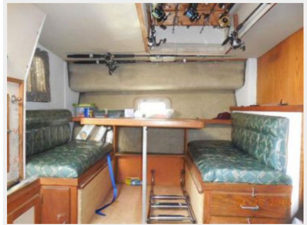
34' Luhrs Open, dinette converts to sleeper