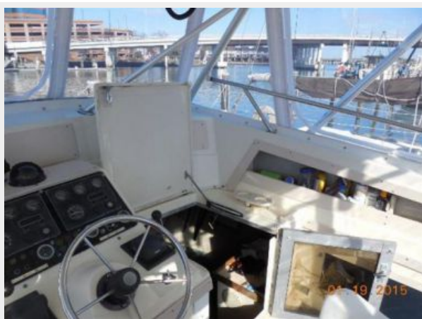
34' Luhrs Open, stbd side of Helm