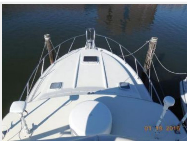
34' Luhrs Open, foredeck view from the tower