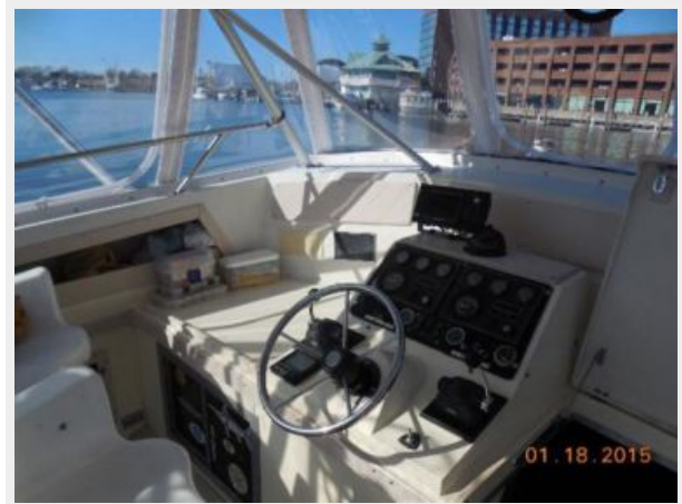
34' Luhrs Open, port side of helm