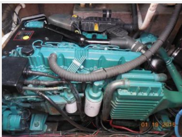
34' Luhrs Open, port side engine