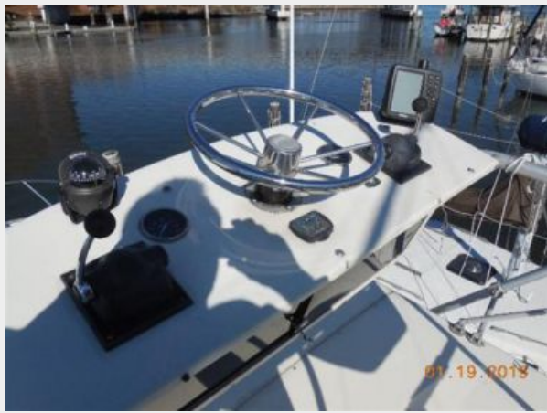
34' Luhrs Open, tower control station