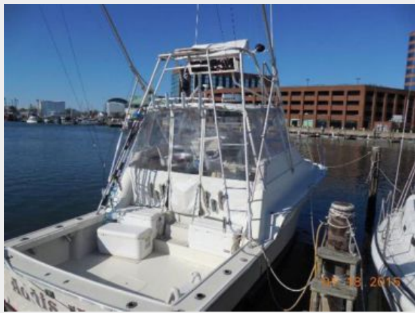
34' Luhrs Open, stbd stern