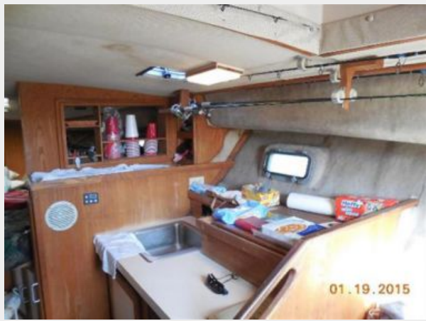
34' Luhrs Open, galley and storage