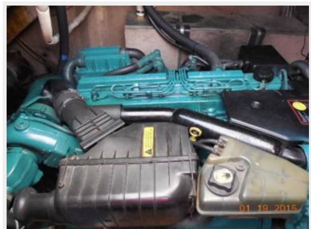
34' Luhrs Open, stbd side engine