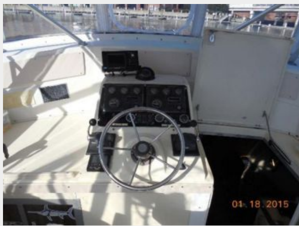
34' Luhrs Open, main helm station