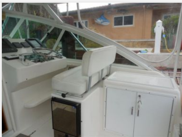
Starboard Helm Deck