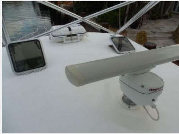
Hard Top Vents, Radar