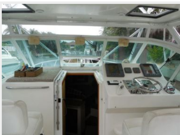
Forward Helm and Cabin Entrance