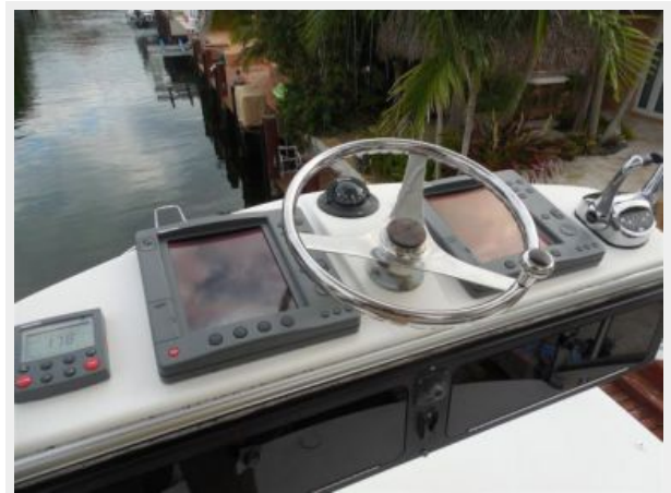
Tower Helm and Electronics