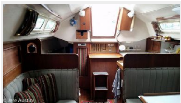
35' C&C salon aft