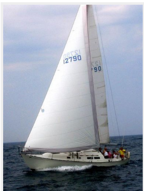
35' C&C underway photo2