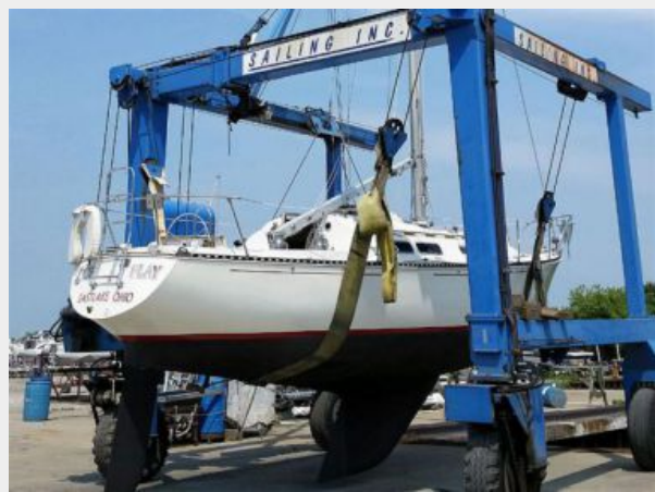
35' C&C hauled out