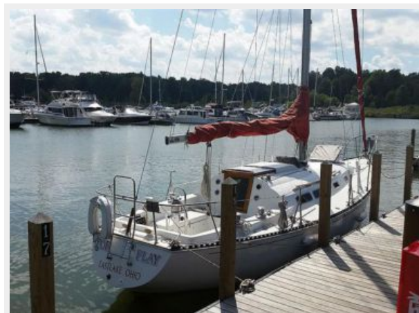
35' C&C aft profile