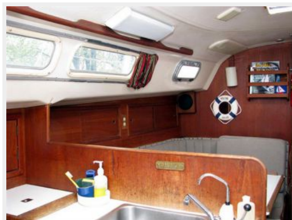
35' C&C salon port forward