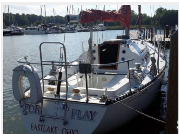
35' C&C cockpit