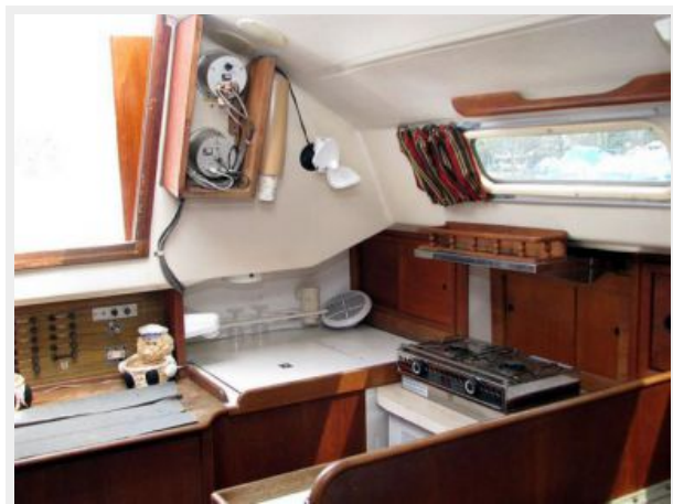
35' C&C galley