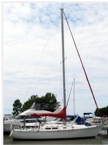
35' C&C starboard profile