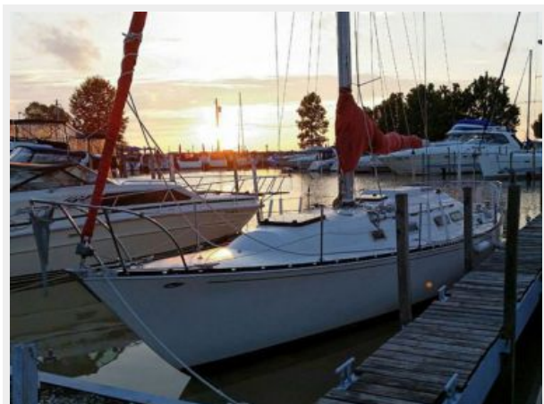
35' C&C Port Forward photo2