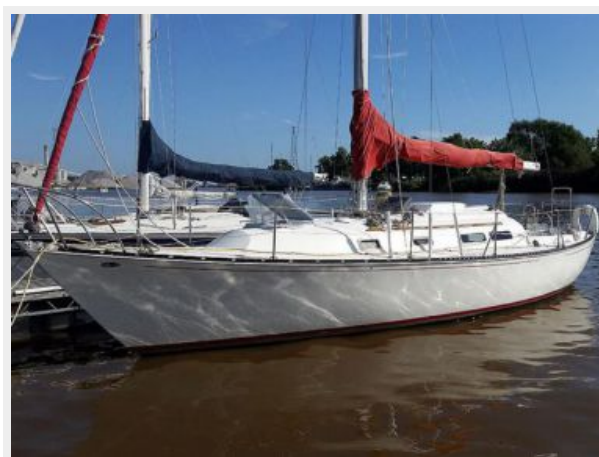
35' C&C port forward profile photo1