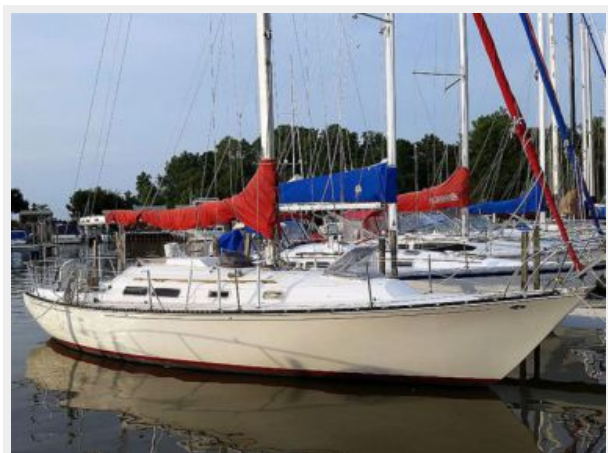
35' C&C starboard forward profile