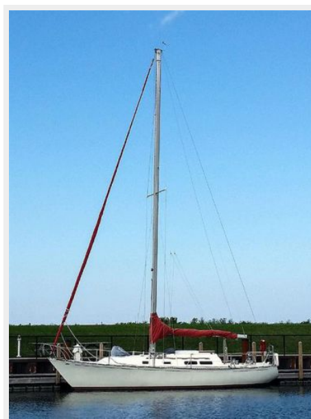
35' C&C port forward profile photo1