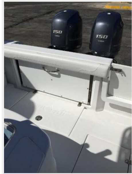
Removable Aft Bench Seat Closed