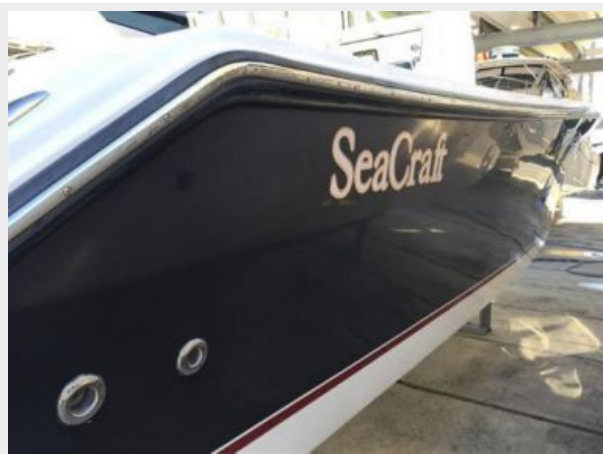
Stbd Side Hull Aft