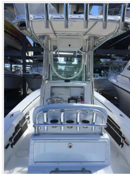
Aft to Fwd View