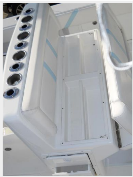
Leaning Post Storage