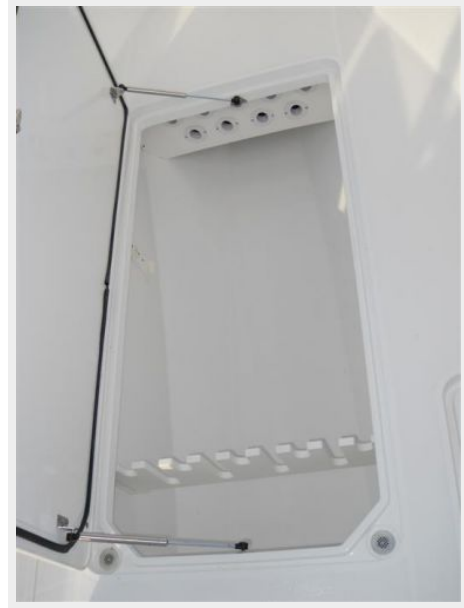
Forward Rod Storage