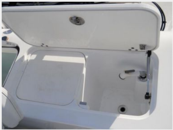
Fresh Water Sink