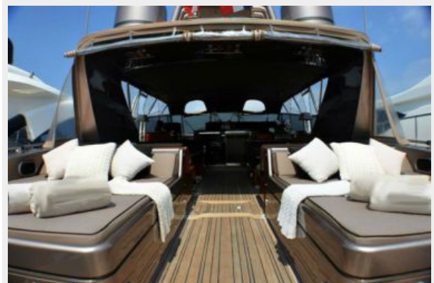
Aft deck sun lounge