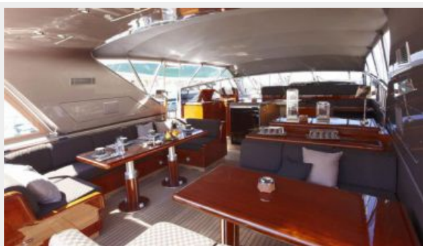
Al fresco dining