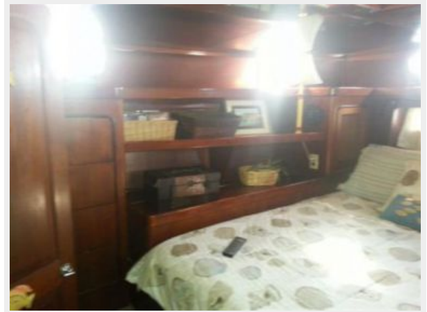
Master Stateroom Starboard