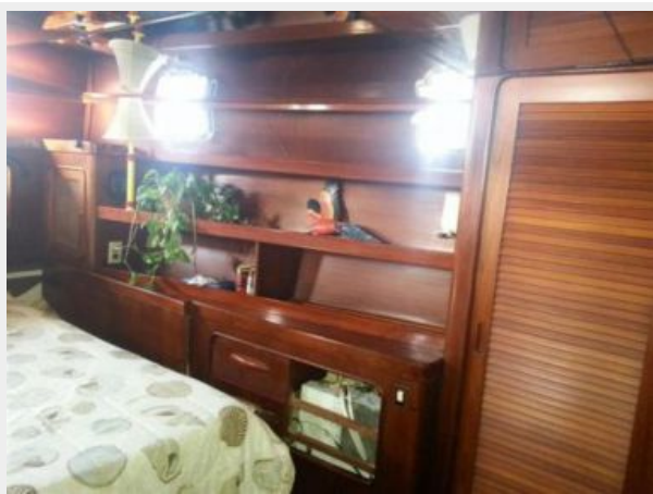
Master Stateroom Port