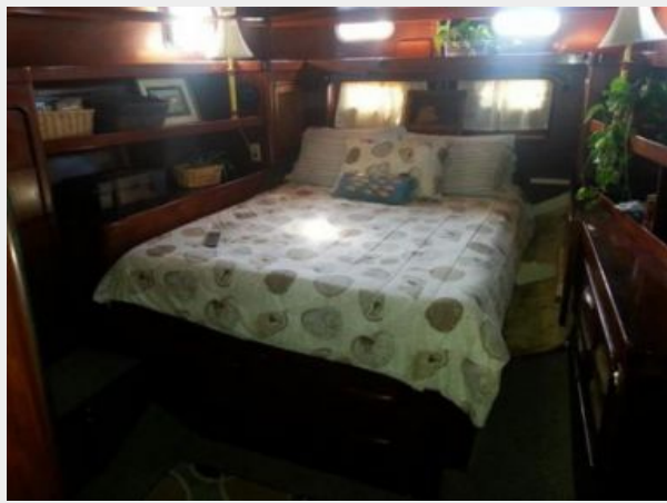
Master Stateroom King