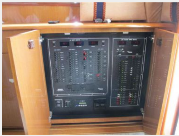
Salon Electrical Panel