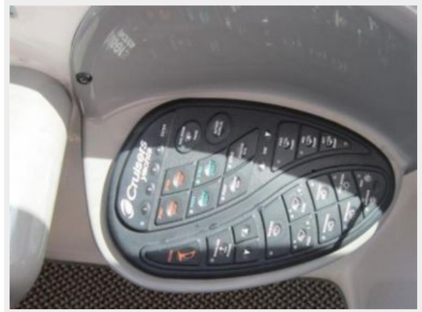
Helm Keyless Touchpad