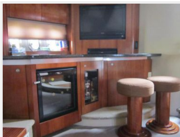
Salon Entertainment Center