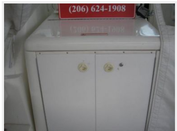
Cockpit Tackle Locker