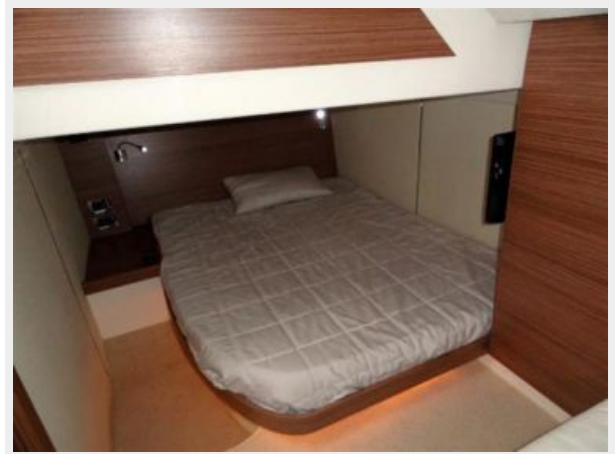
2nd Stateroom 3