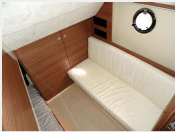
2nd Stateroom 2