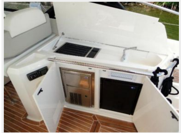
Cockpit Galley 2