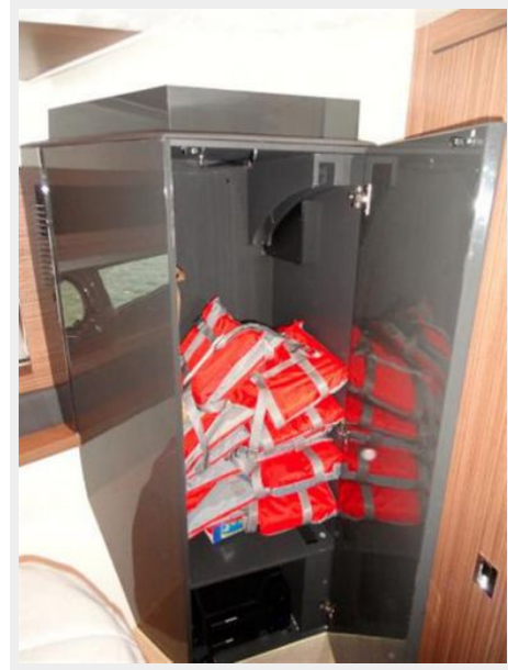
Forward Stateroom Closet