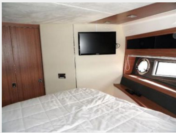
Forward Stateroom 3