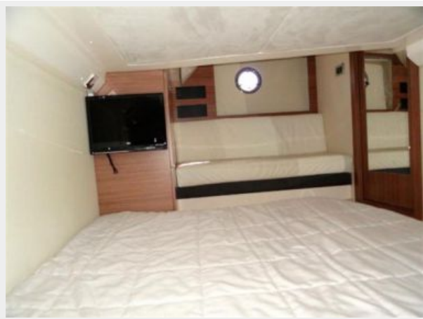
2nd Stateroom 4