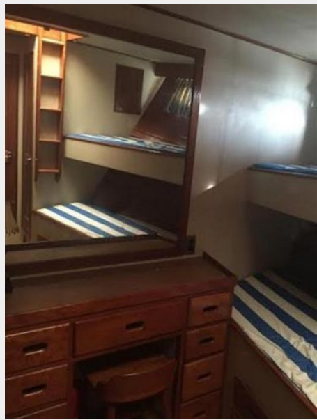
Forward Berth #2