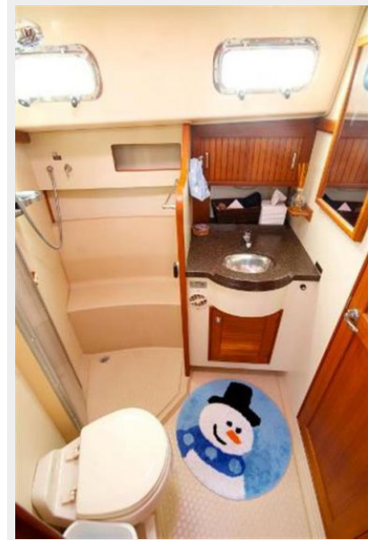
Forward head and shower