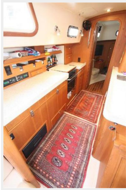
Looking aft along galley