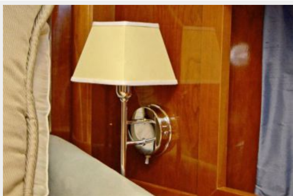
Master Stateroom Lighting