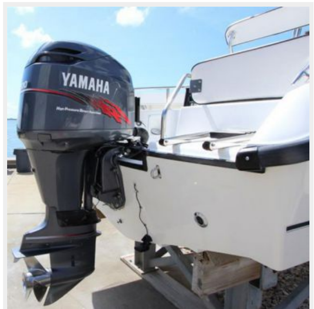
200 HP HPDI Yamaha Outboard Engine