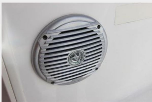
Jensen Marine Speakers In Cockpit