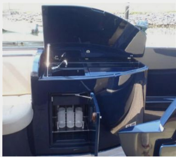
Wet Bar to Stbd 1