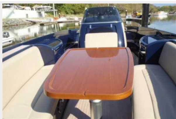
Forward Dining 1