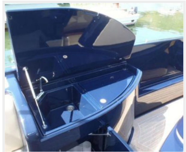
Wet Bar to Stbd 2