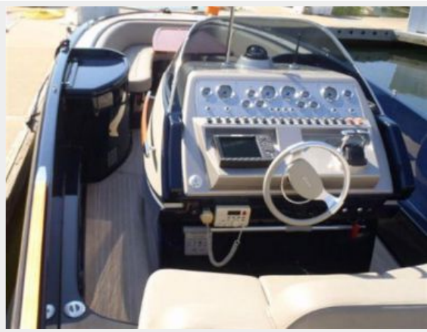
Helm to Port