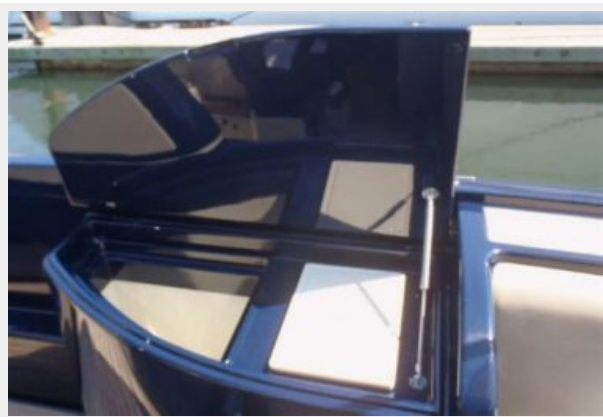
Wet Bar to Stbd 3