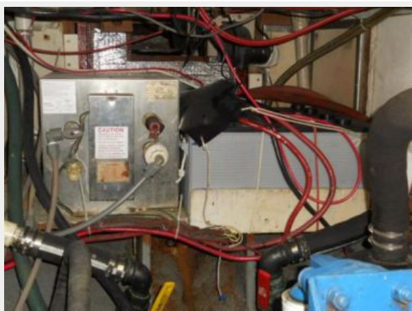
HW Heater / NEW AGM BATTERIES (2014)