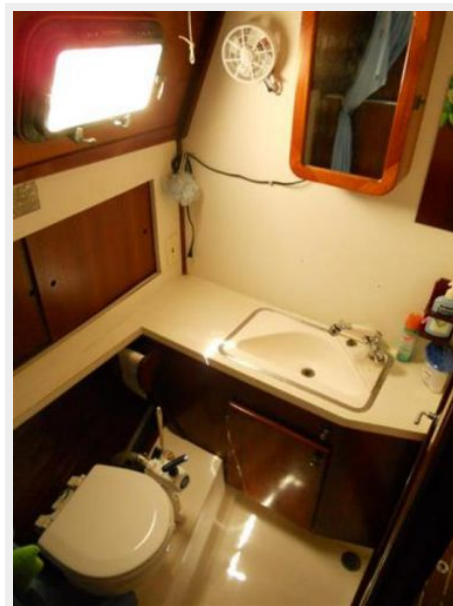
NEW Head / Shower (2012)