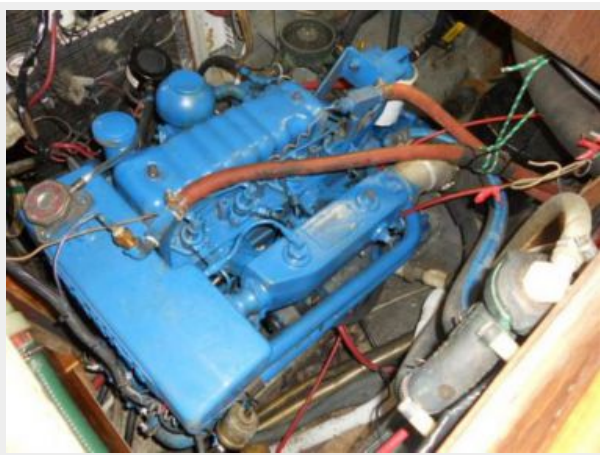
50HP PERKINS 4-108 (TOTAL REBUILD 3/2012)