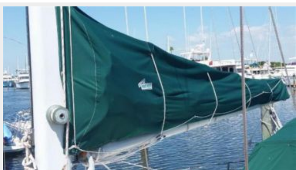
NEW Main Sail & Mac Pack (2014)