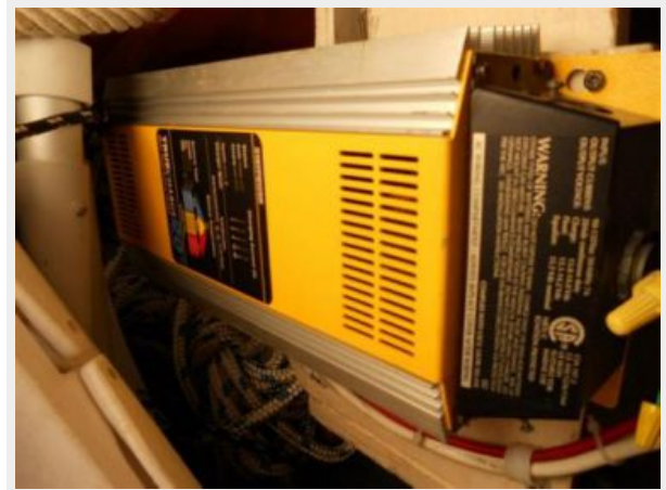
TRU-CHARGE Battery Charger