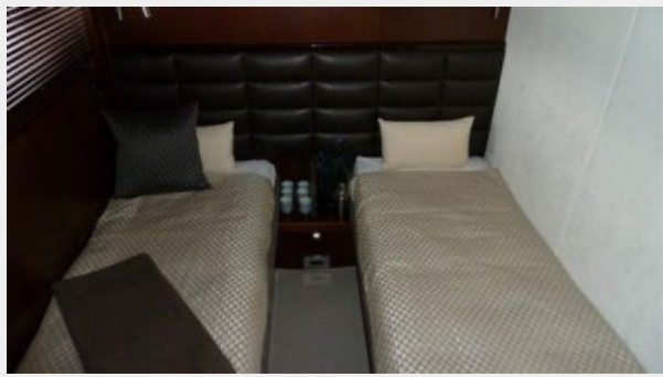
Port Guest Stateroom