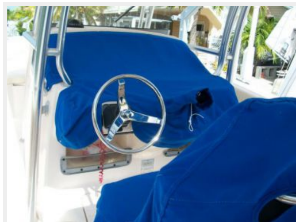
Console and Seat Covers