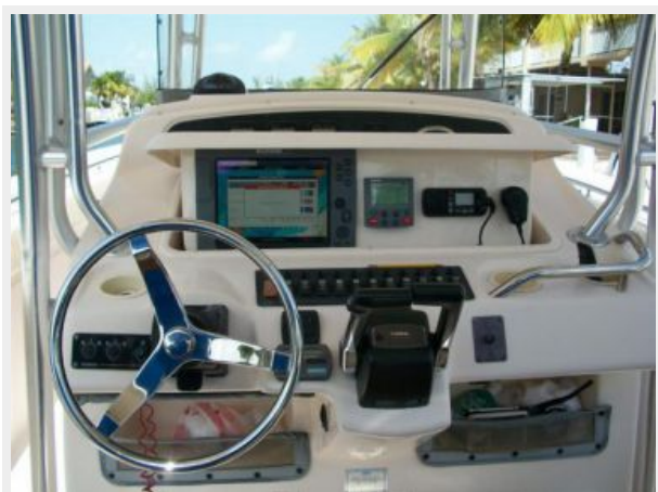
Helm - Nav Instruments