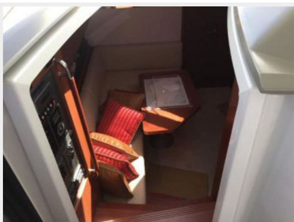
Entry to Cabin