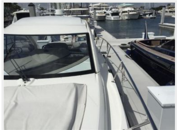
View from Port Bow