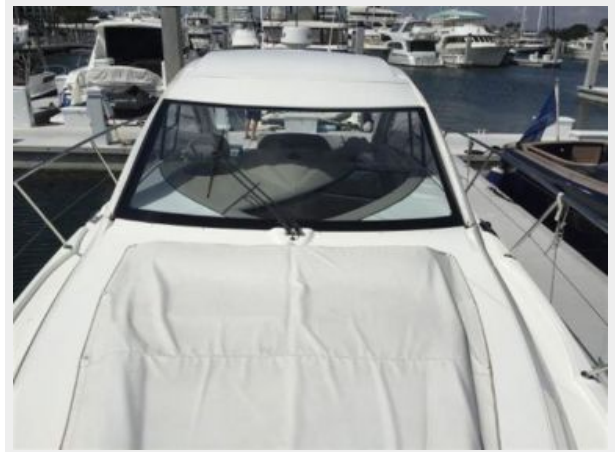
View from Bow - Covered Bow Cushions