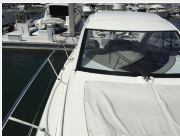
View from Starboard Bow