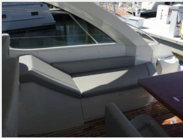
Starboard Chase Lounge