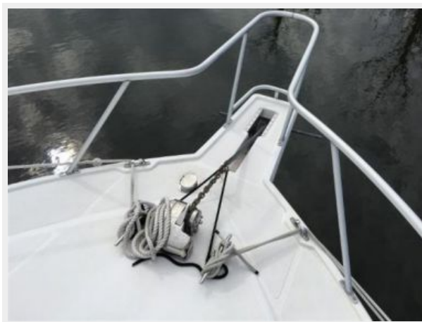
Bow - Electric Windlass