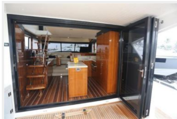
Cockpit Bi-Folding Doors