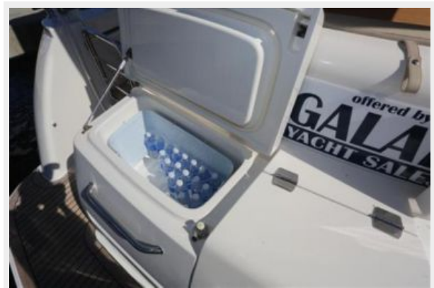
Entrance to Lazarette