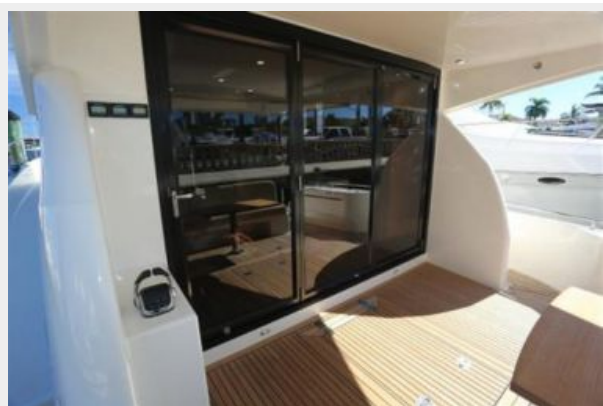
Cockpit Docking Station