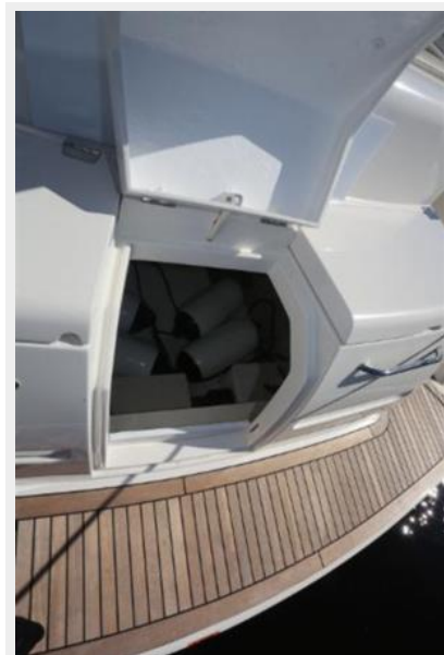
Entrance to Lazarette