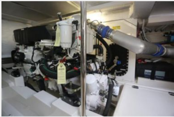
Starboard Volvo D11 670HP