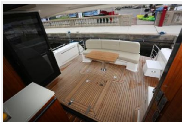
Open Aft Galley to Cockpit