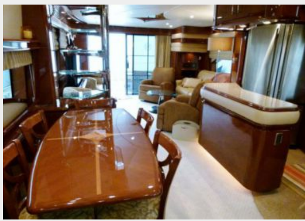
Dining Area 1