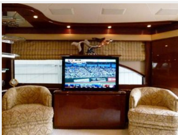
Salon Starboard Side 1