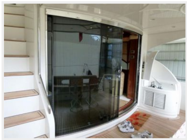
Aft Deck/Salon Entry