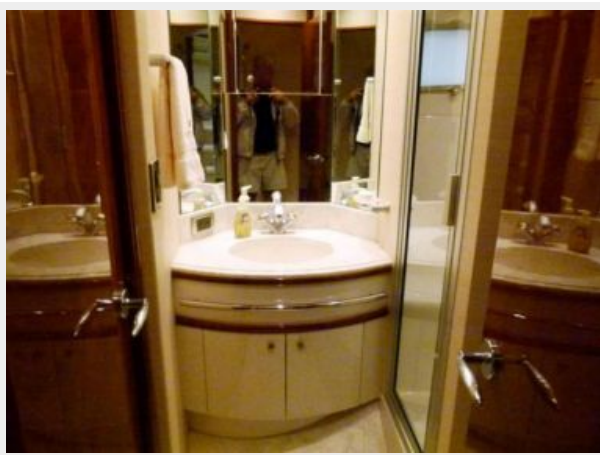
Guest Head 1