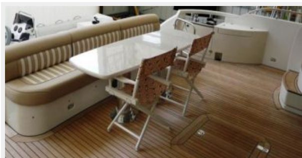
Aft Deck Lounge