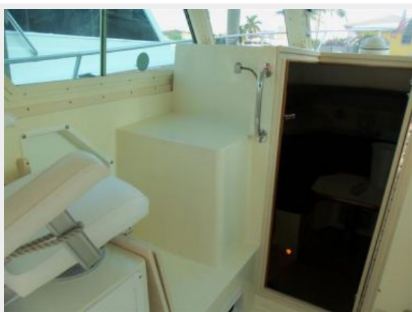
Helm Area to Port