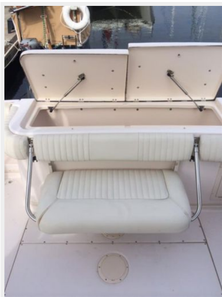
Aft Seat Down