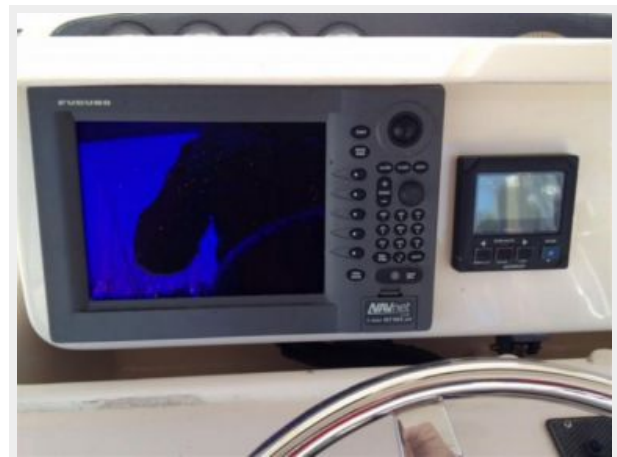
Furuno NavNet Display