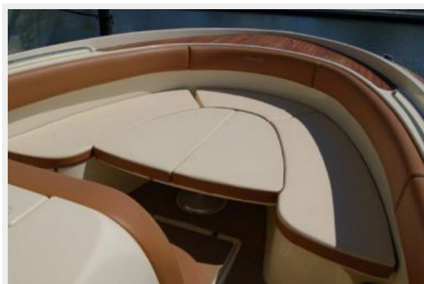
Bow-Table Down with Cushions