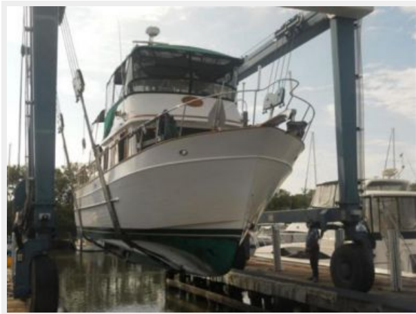
STARBOARD BOW (Haulout 12-2013)