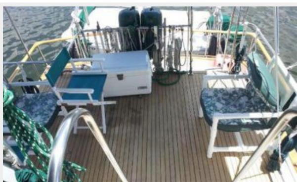
Mid Deck from bridge