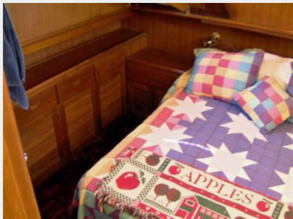
Master Stateroom Starboard