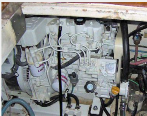
Northern Lights 8 KW Luger GenSet (348 hrs.)