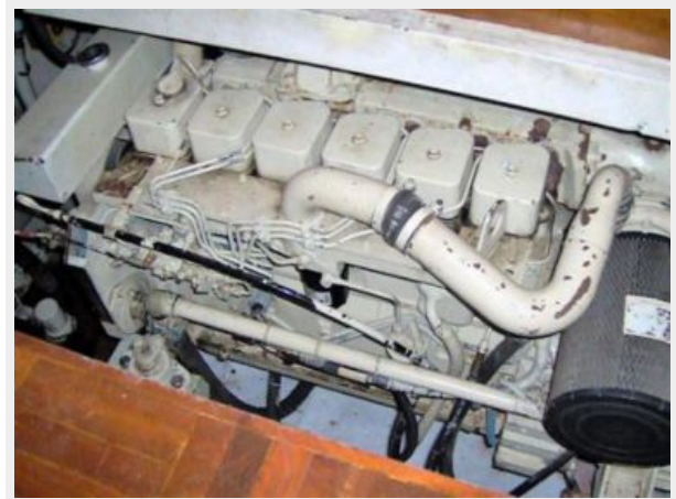
210 HP Cummins (<1150 hrs.)