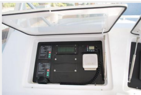
Fly Bridge Helm