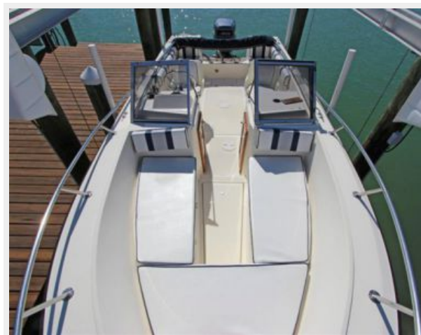
Bow Looking Aft