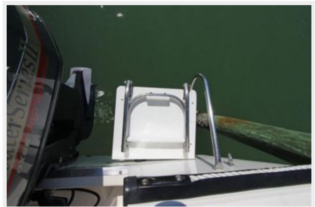
Swim Step W/Fold-Down Stainless Ladder