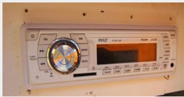
Pyle CD/Radio Pyle CD/Radio