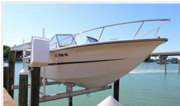
Bow W/Stainless Railing