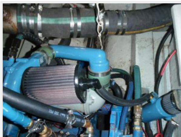
Walker Airsep System