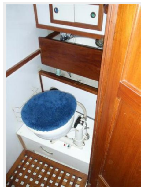
Guest Head I