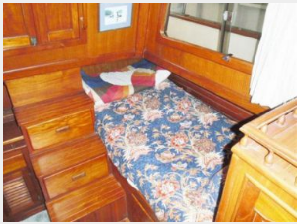
Master Stateroom Port