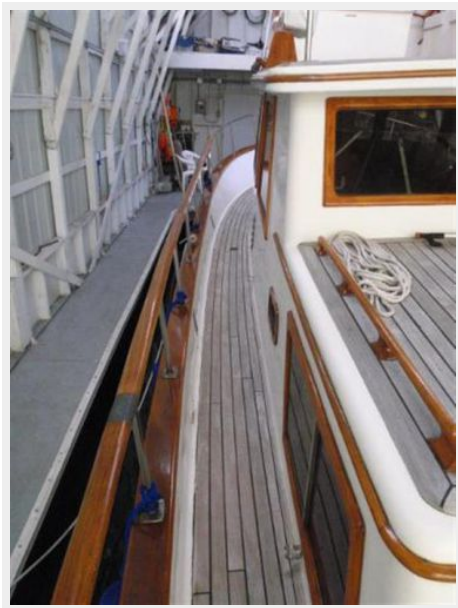
Port Side Deck