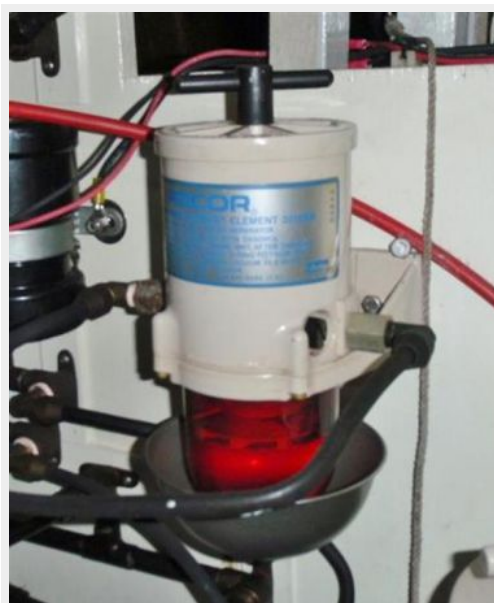
Coast Guard Approved Racor Fuel Filter