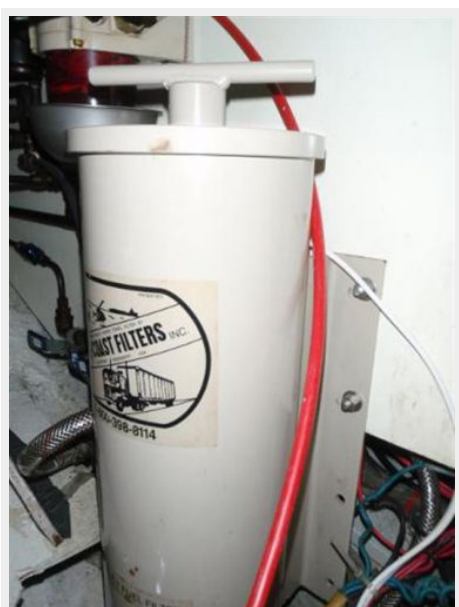
Gulf Coast Oil Filter