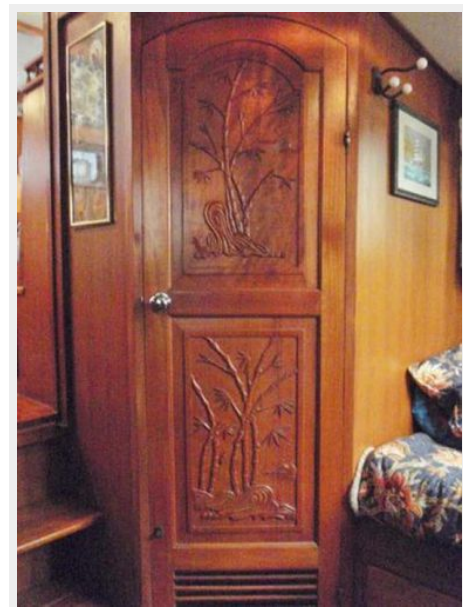
Head Door Detail