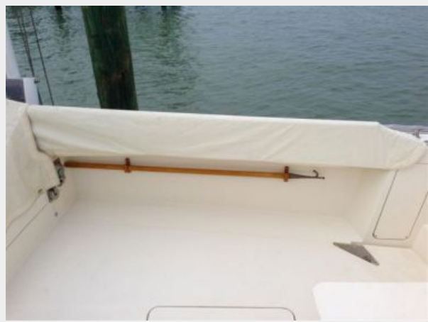
Coaming Board Covers