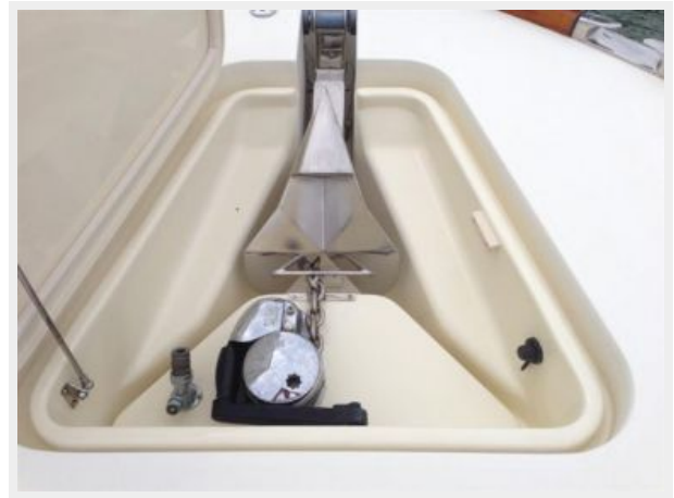
Fold Away anchor w/Windlass and Washdown