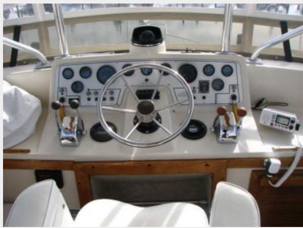
Helm / Electronics & Navigation 1 - Upper Helm