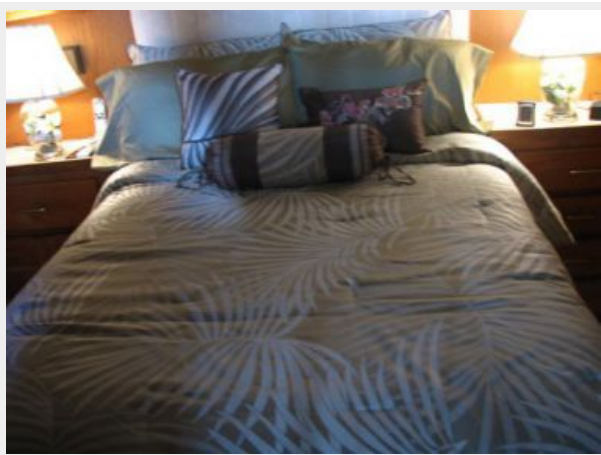
Master Stateroom, Aft