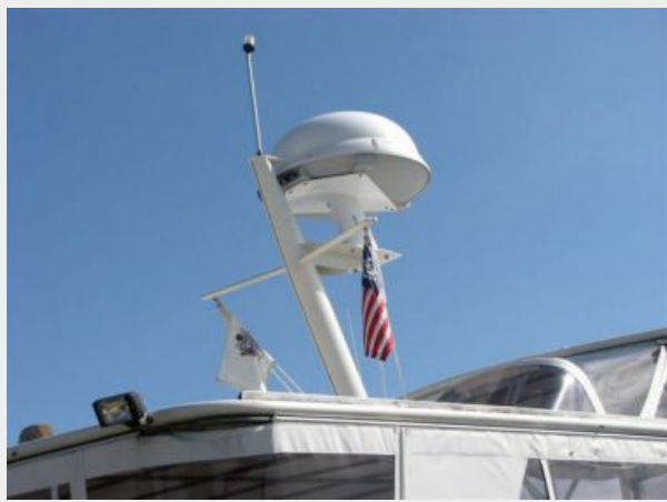
Helm / Electronics & Navigation 3 - SAT TV