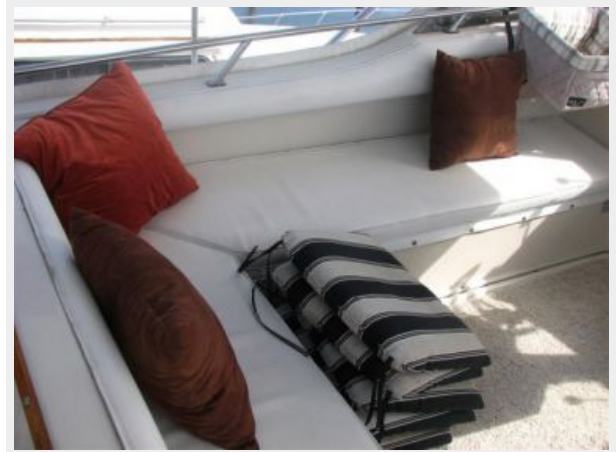
Deck 1 - Upper Helm Seating