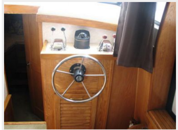
Helm / Electronics & Navigation 2 - Lower Helm