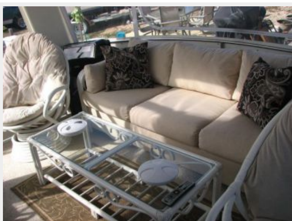
Deck 2 - Aft Deck