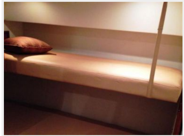
Guest cabin with upper bunk that can be lowered to form back for settee