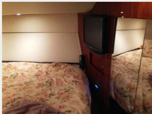
Master to Starboard with TV and mirrored closet