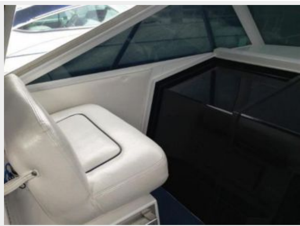
Port Guest seating accross from Helm