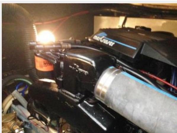
Clean Engine room - 1