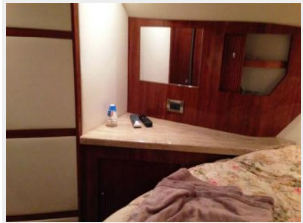
Master to Starboard counter and storage