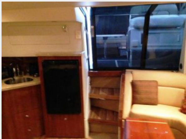
Salon looking aft to cockpit entrance