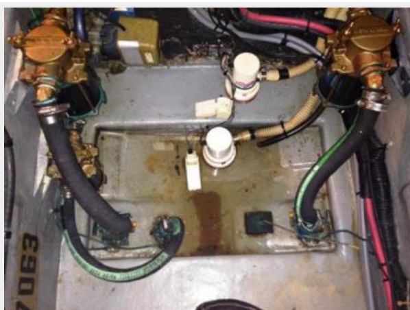
Bottom of Engine room (Sea Chest)