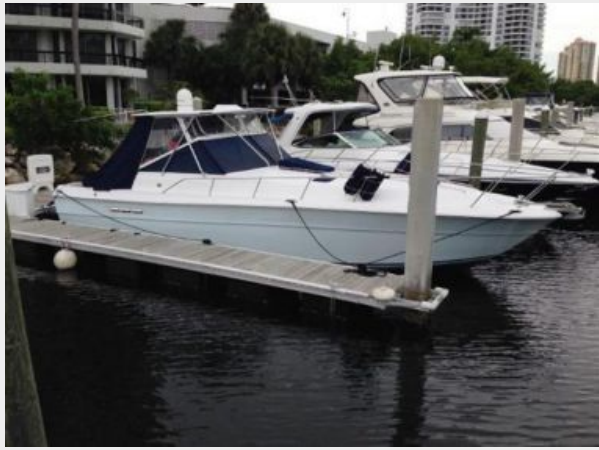
Starboard profile - Custom hard top and enclosure