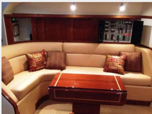
Main Salon L-shaped settee to Port