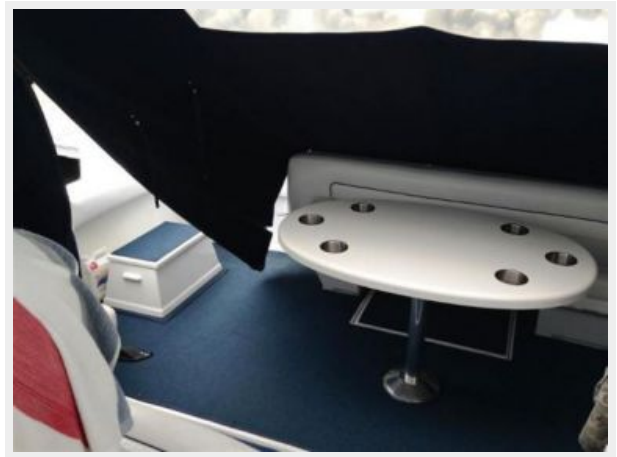
Lower cockpit seating and table