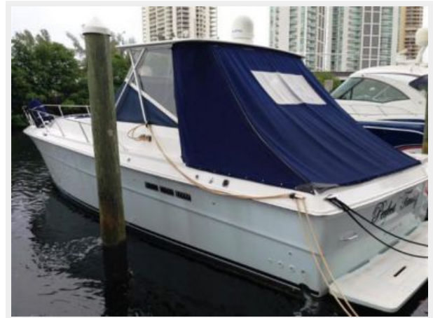
Full aft enclosed cockpit with windows