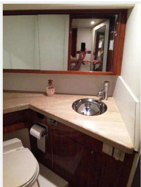
Head sink and electric toilet