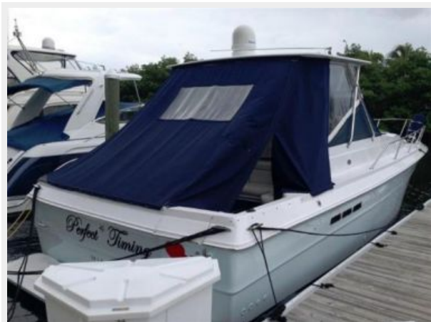
Full cockpit protection