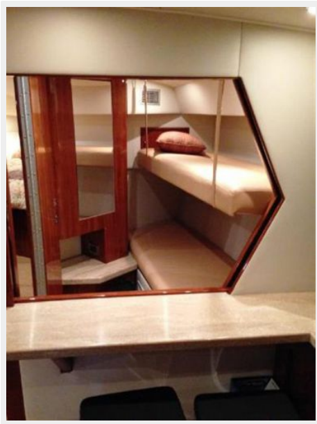
Guest cabin with closing bulkhead open to salon