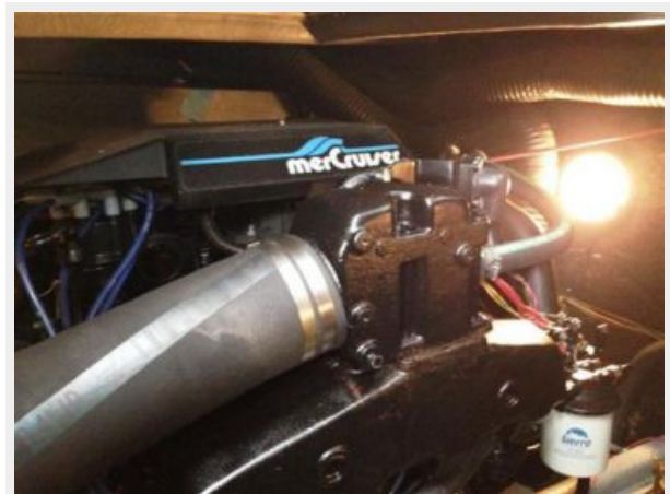
Well maintained Engine room - 2