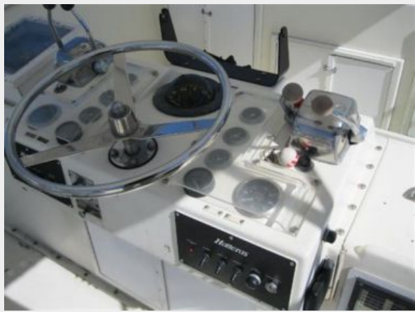
New engine switch panel