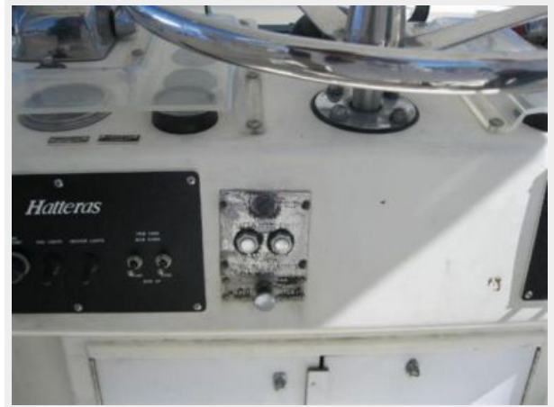
Wood freeman auto pilot