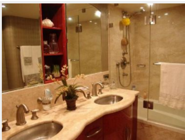
Master head vanity