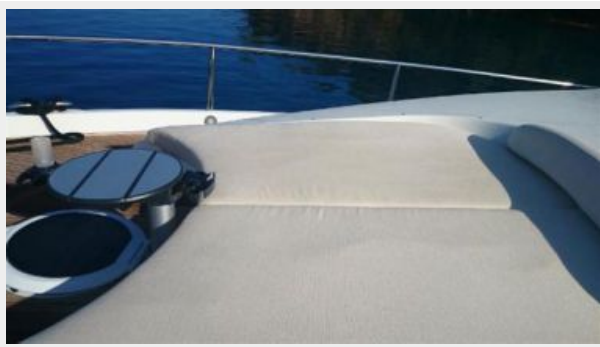
New foredeck sun lounge w/custom table