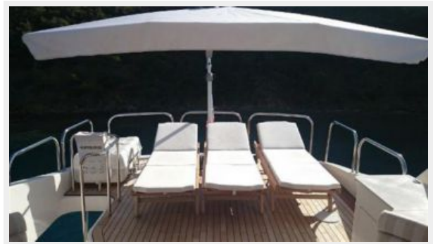
New bridge deck sun lounge