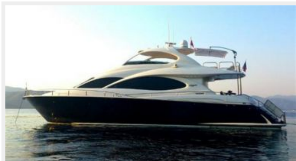
Port side view