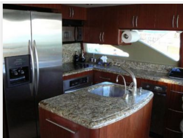
Full size galley