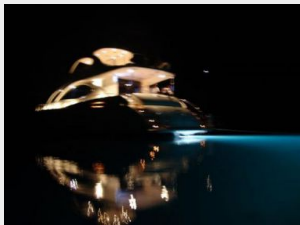
Night time glow