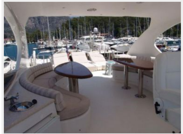
Flybridge aft before teak decking