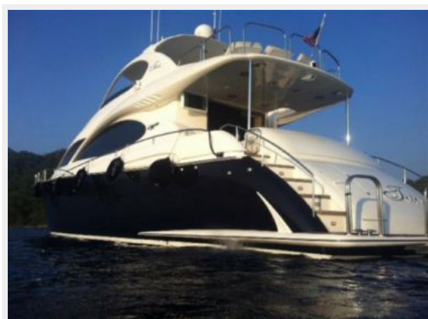
Port aft with new hull paint