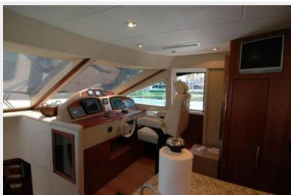
Lower helm station