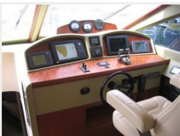
Lower helm station