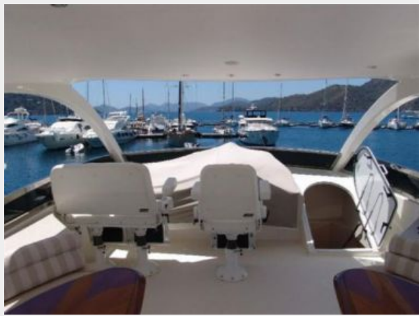
Flybridge forward before teak decking