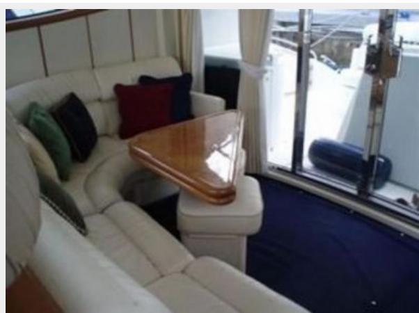
Upper salon aft