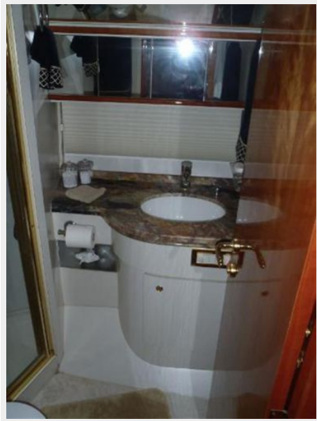
VIP guest head