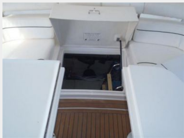
Engine room access