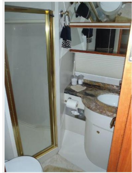
VIP Guest stall shower