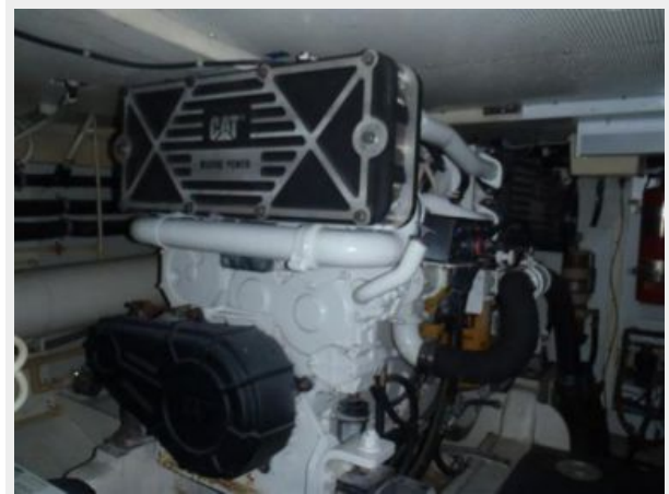
800hp Caterpillar 3406 Port