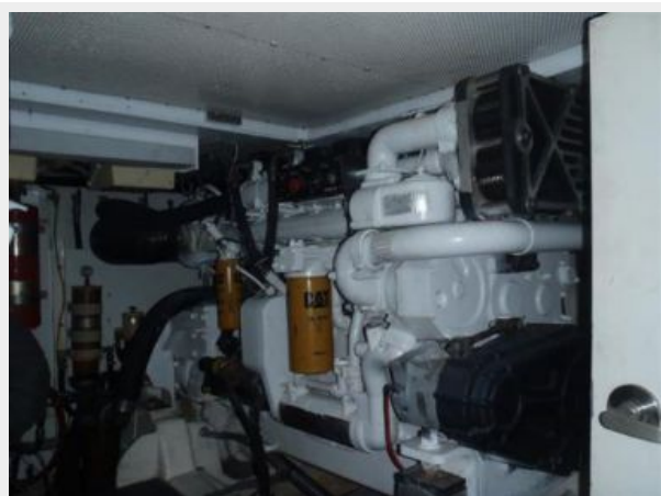
800hp Caterpillar 3406 Stbd