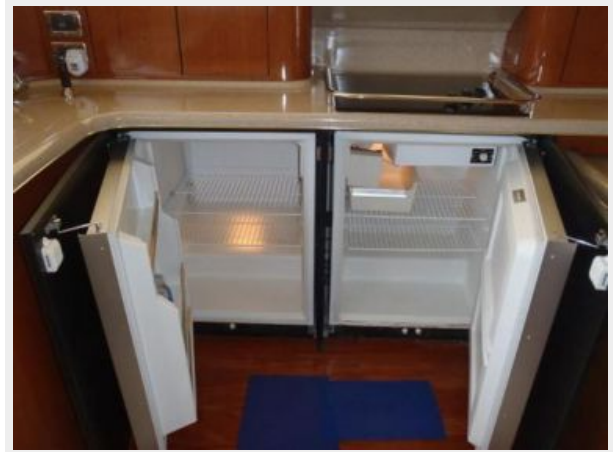
Subzero refrigerator and freezer