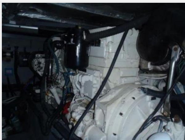
Stbd Cummins diesel