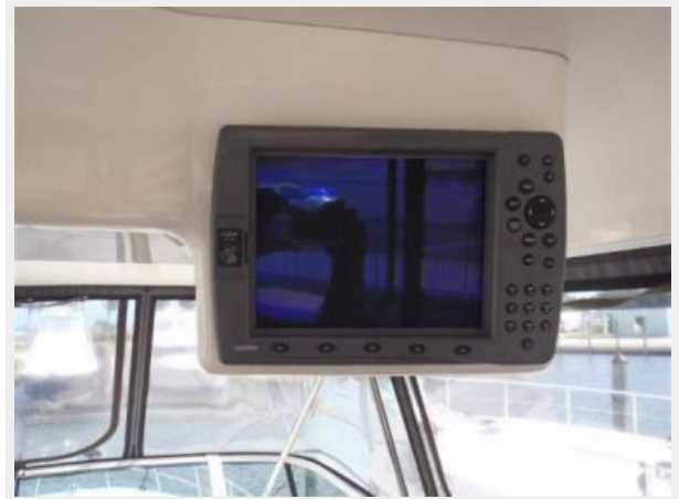
Garmin 2010C color plotter