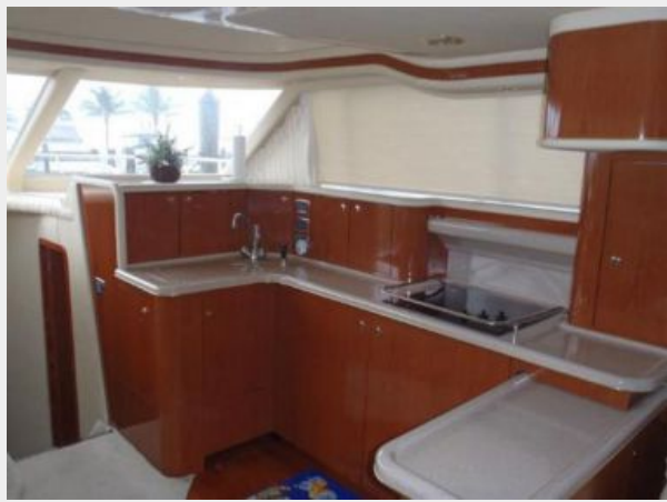
Galley with pull out counter