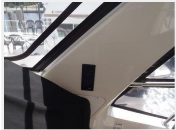
Bridge A/C control