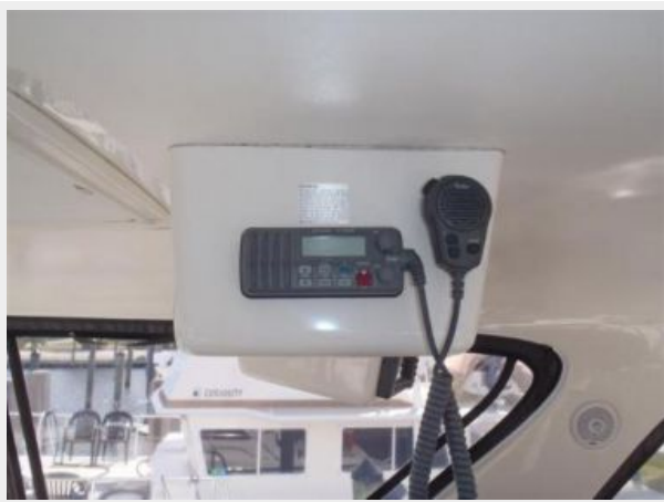
ICOM IC-M302 VHF radio