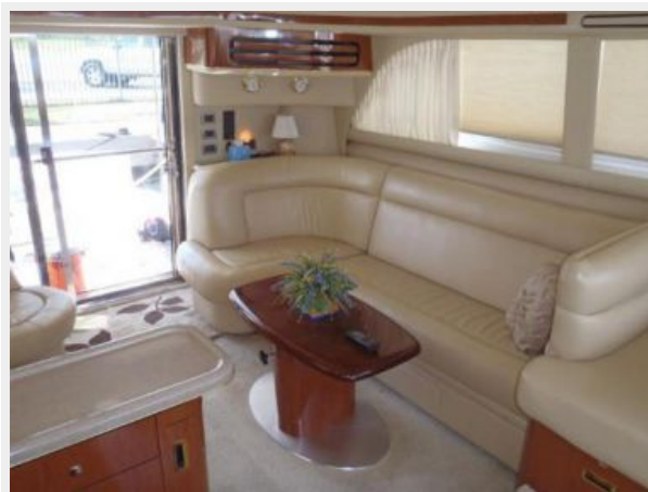
Main salon convertible sofa