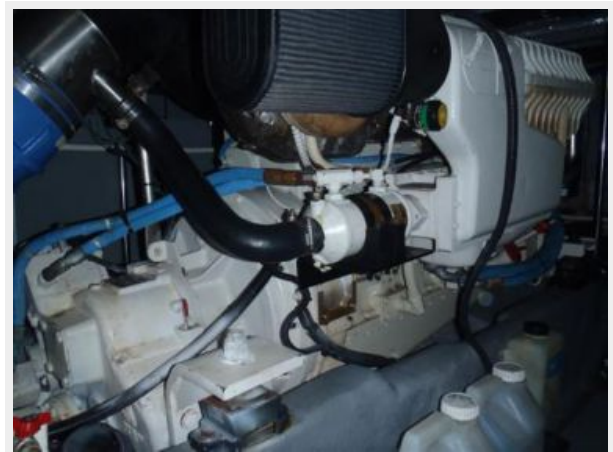
Port Cummins diesel