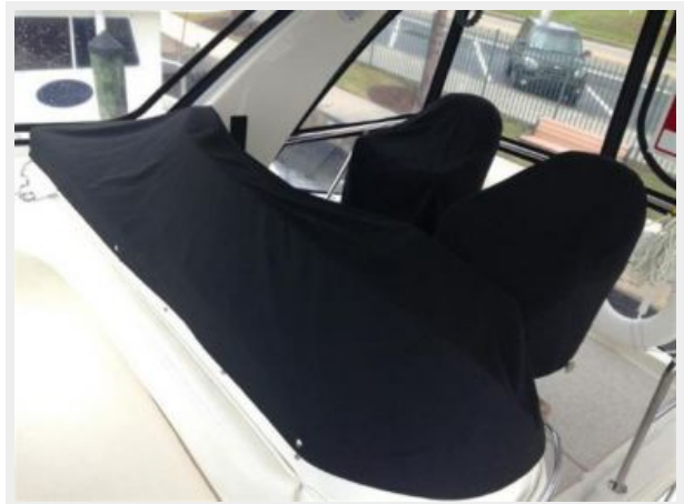
Helm and seat covers