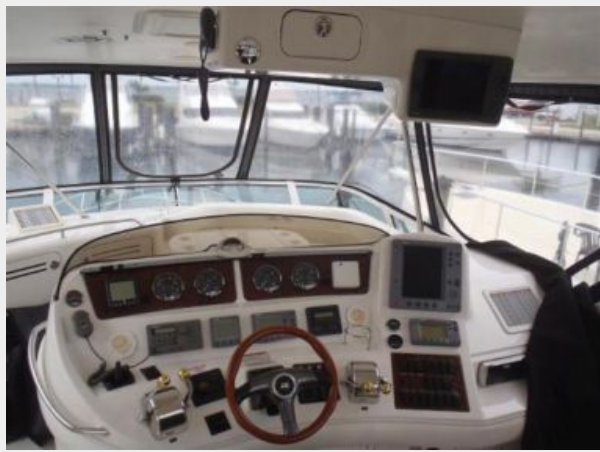
Helm console with overhead electronics box