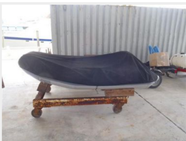
RIB inflatable tender with new cover