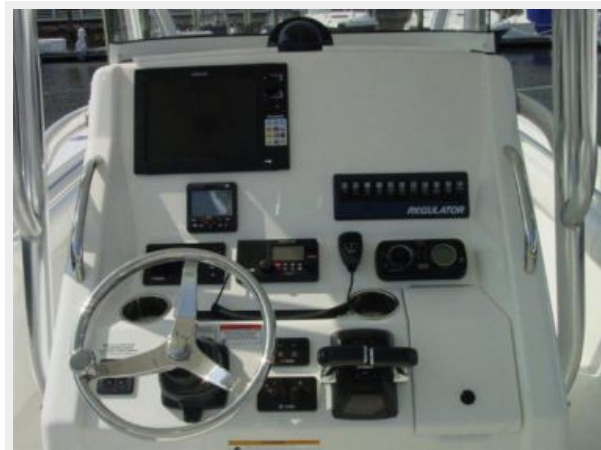
Electronics & Navigation