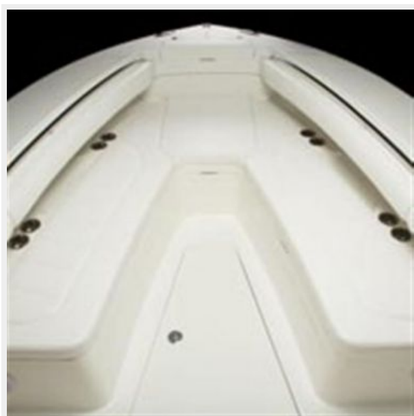
Sistership Deck Seating