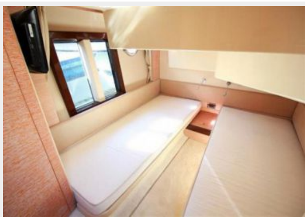
Starboard Stateroom 2