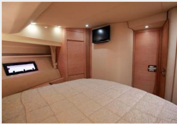
Forward Stateroom 2