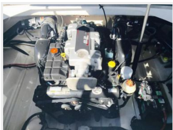
Mercuriser 8.2LMPI 380hp