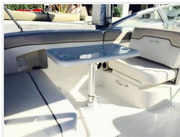
Aft Cockpit Settee