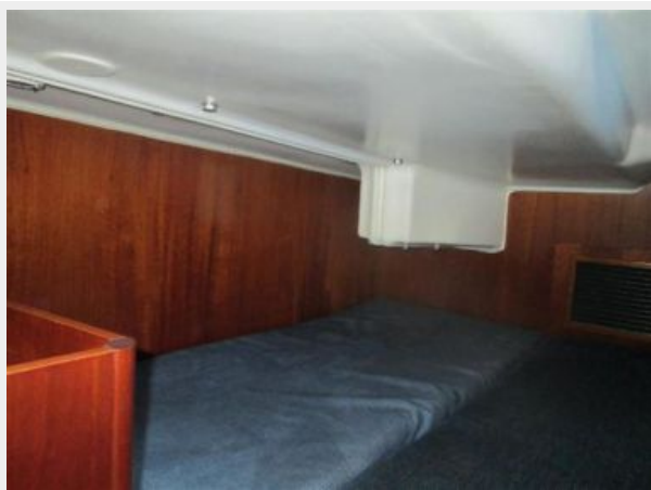
Aft Cabin Berth 2