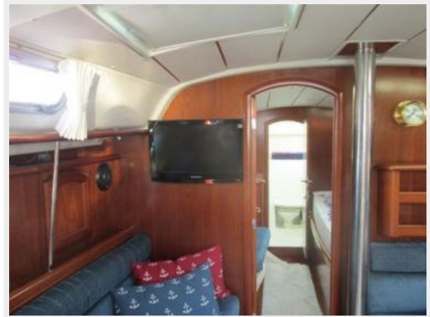
Salon looking forward