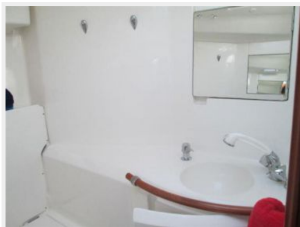
Forward Head 1