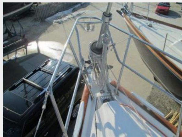
Bow with Profurl Furler