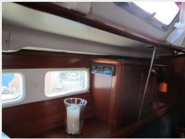
Salon looking forward and port