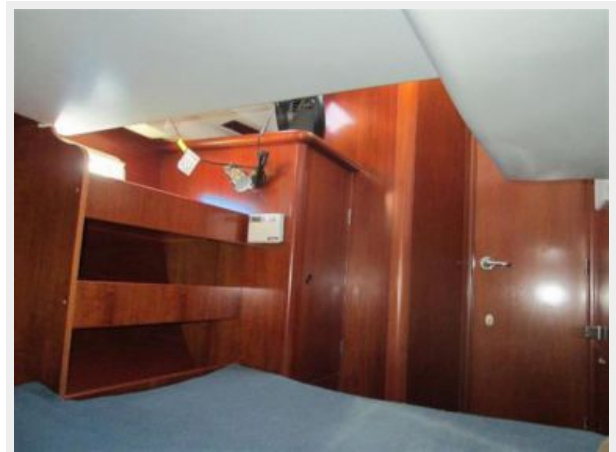
Aft Cabin Hanging locker and Storage