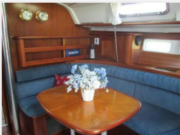
Convertible Salon Table/Berth to Stb.