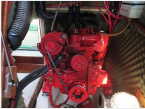
Very Clean engine