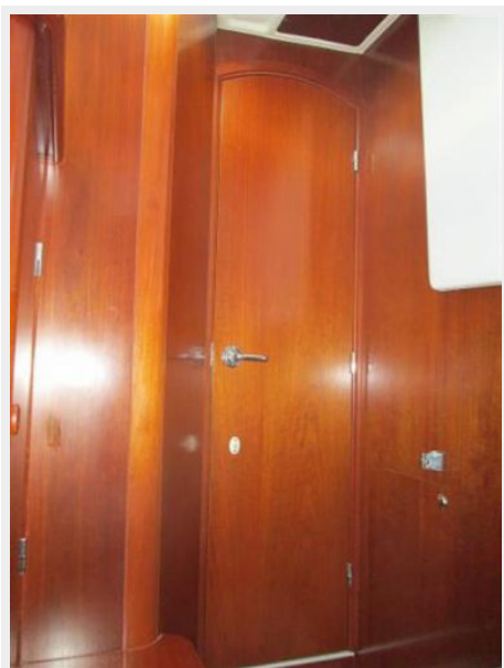
Aft Cabin 4