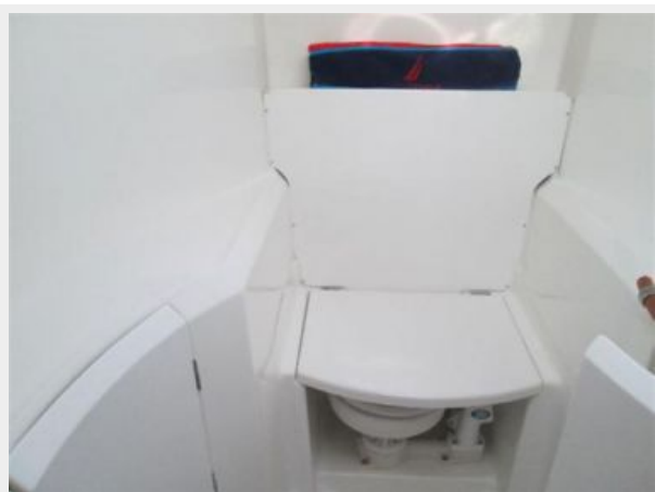
Forward Head 2