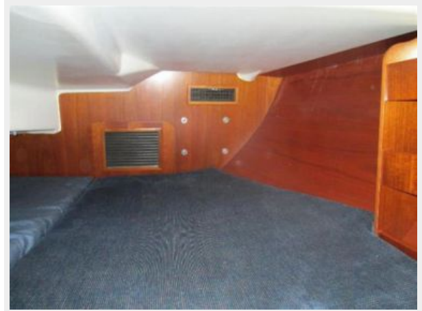
Aft Cabin Berth 1