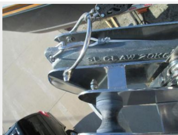
Lewmar Claw 20KG