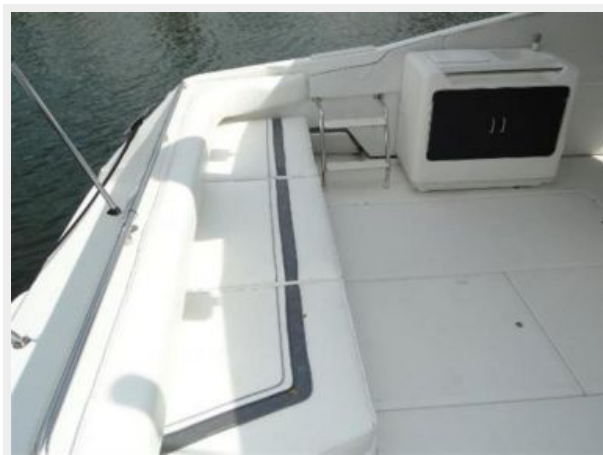
Bench Seating Cockpit