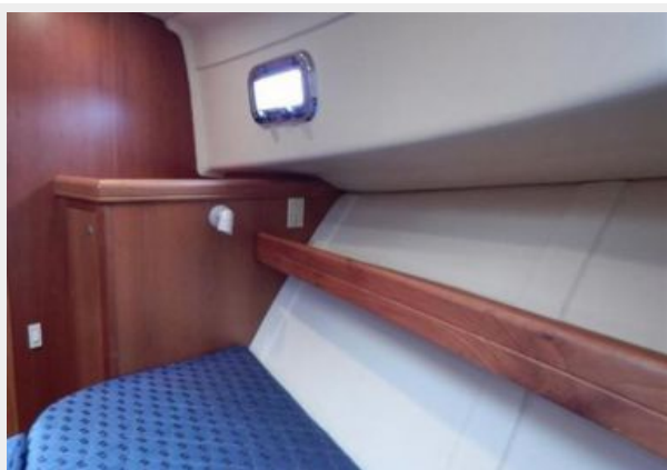
Master Cabin Port