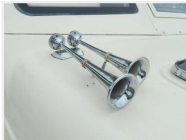
Deck Air horns