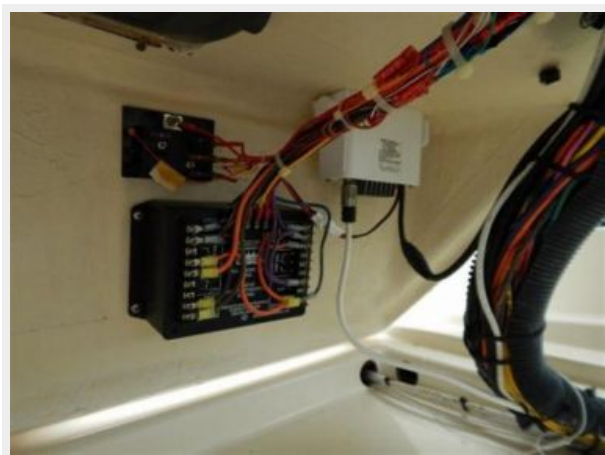
Cockpit Helm Wiring