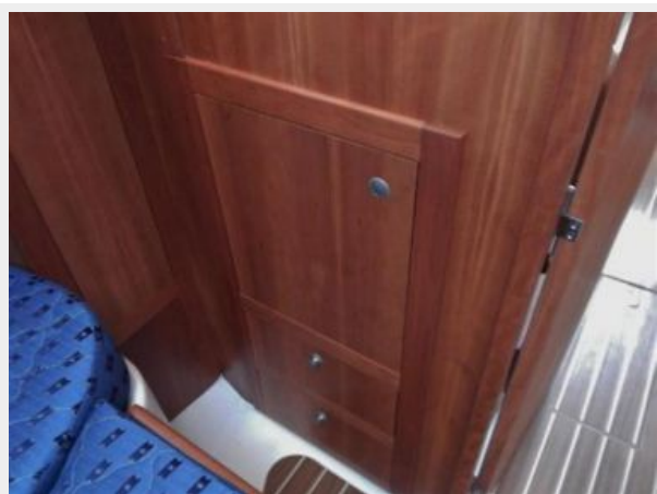
Master Cabin Storage 1