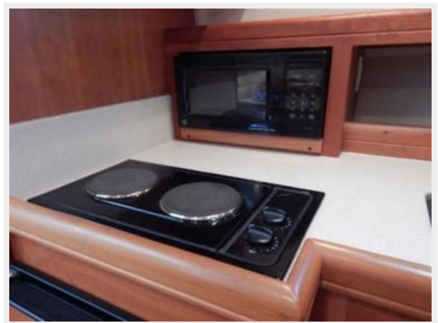
Galley Stove top and Microwave