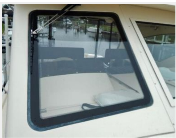
Deck Stbd Windshield