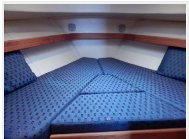
Master Cabin Berth