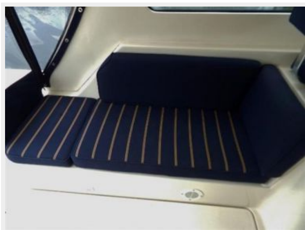
Cockpit Port Settee Converts to berth