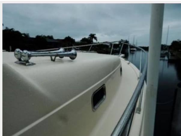
Deck Stbd forward