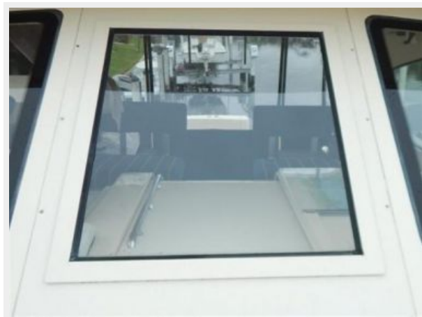
Deck Center Windshield