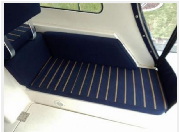
Cockpit Stb Settee Converts to berth