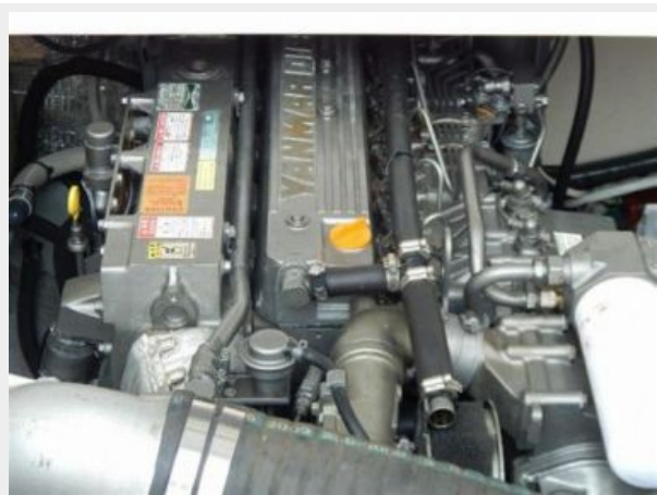
Engine Close up