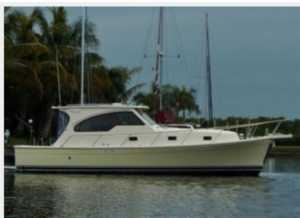
Underway Stbd Profile