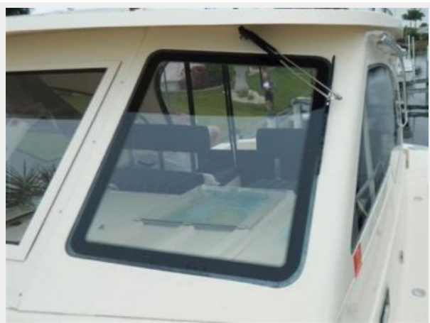
Deck Port Windshield