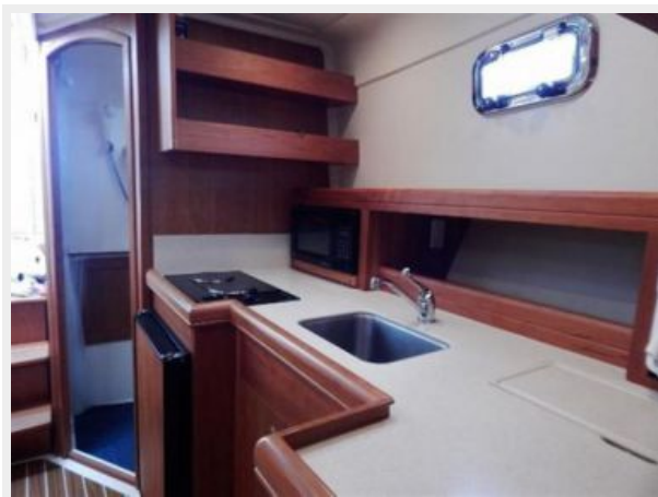
Galley from forward