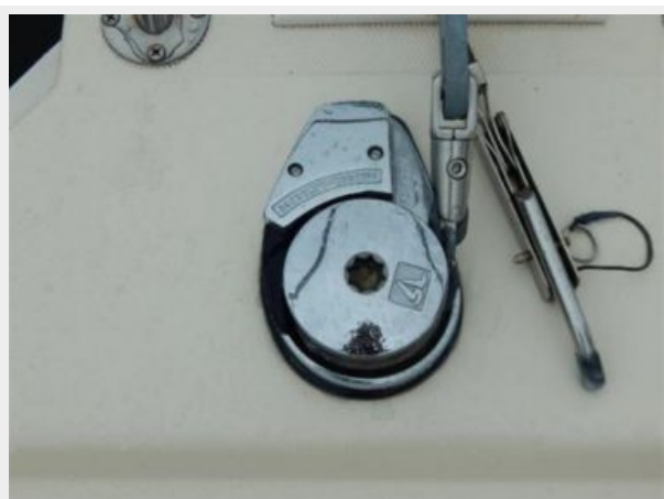
Deck Anchor Windlass