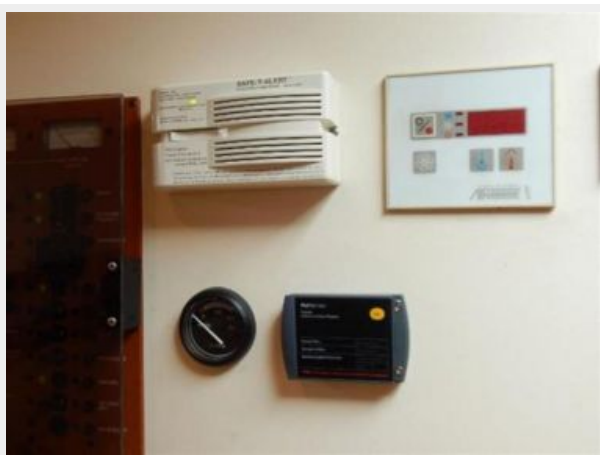
Salon Control Panels Close up