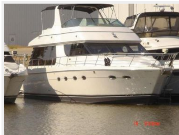
570 Voyager Pilothouse